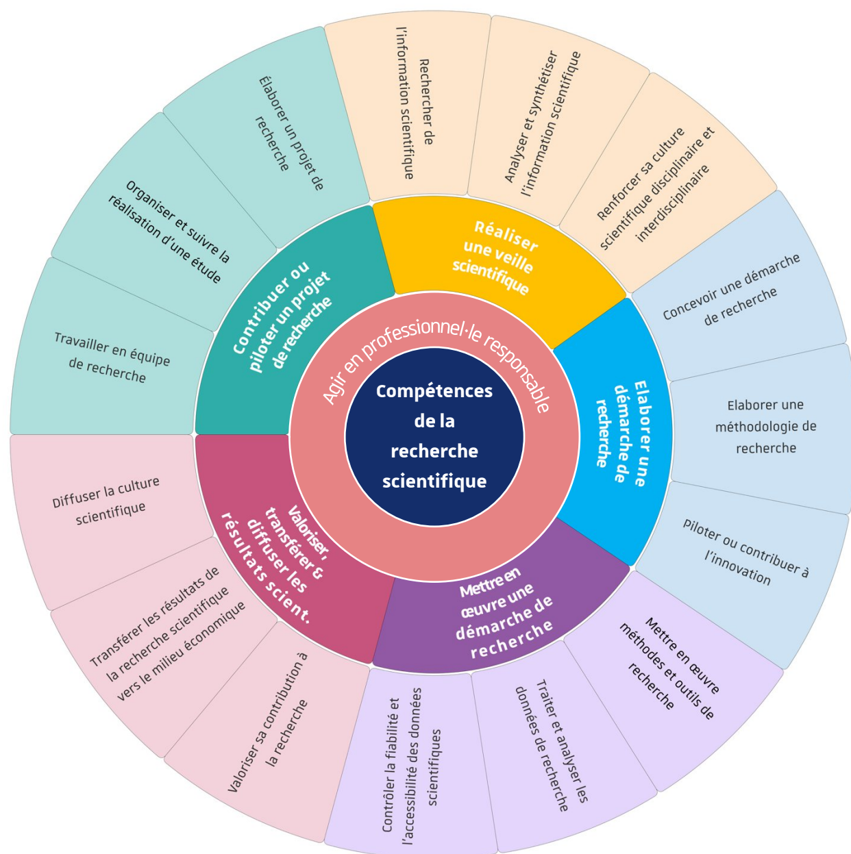
Compétences de la recherche scientifique

Nous considérons que maîtriser la compétence de la recherche scientifique c'est être capable d' « élaborer, conduire, évaluer et partager une recherche scientifique, expérimentale ou non, dans le but de produire des connaissances sur un sujet, avec intégrité scientifique et esprit critique ».