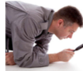
nov. 2013