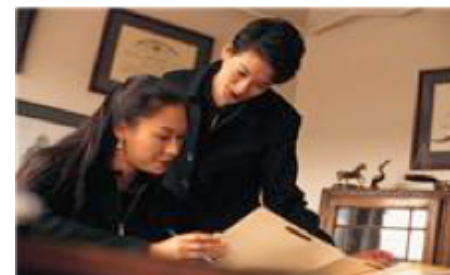
Fotolia nov. 2013