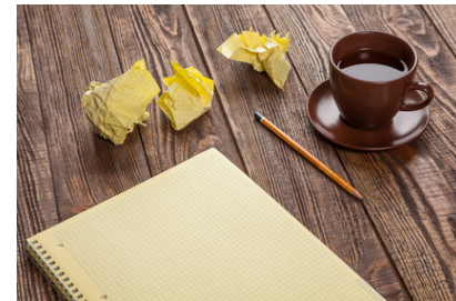
Fotolia nov. 2013