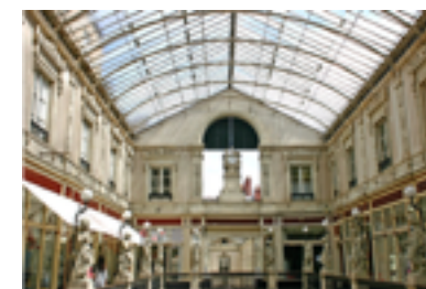
Fotolia nov. 2013