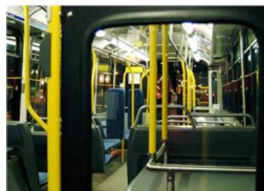
Fotolia nov. 2013