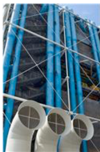
Fotolia nov. 2013