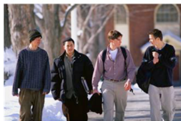
Fotolia nov. 2013