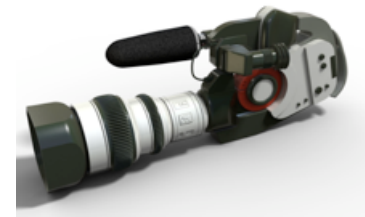
nov. 2013