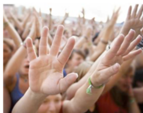
Fotolia nov. 2013