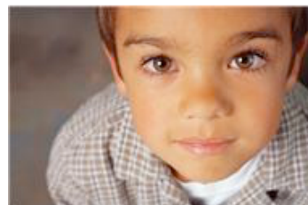
Fotolia nov. 2013