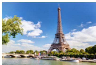
nov. 2013