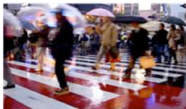
Fotolia nov. 2013